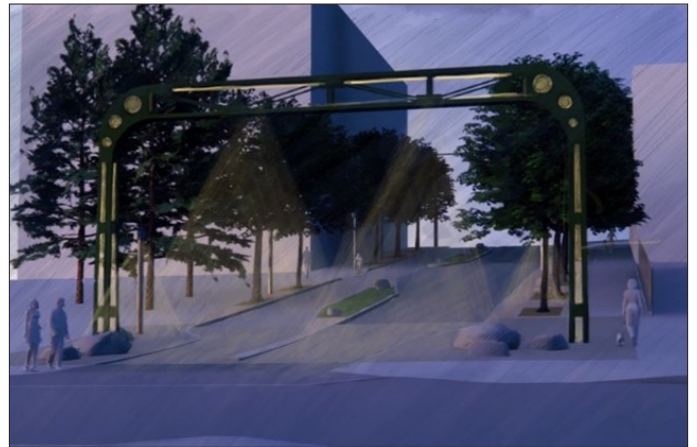
Alaskan Way Viaduct 标志桥将在夜间照明，并将作为一个地标，欢迎游客到访改善区和 Belltown。