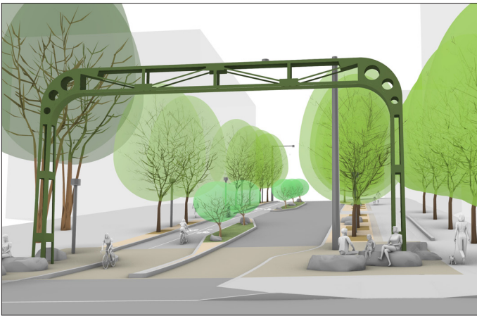
Bell St 规划视图，Bell St 和 Western Ave 交叉口东向视图。

项目改善优先考虑行人和骑自行车者的安全、可及性和机动性。该项目将增添一条双向保护自行车道，拓宽人行道，增加 Elliott Bay 和 Seattle Waterfront 景观观赏座位，并在两个街区走廊沿线增加绿化。该项目还纳入历史悠久的 Alaskan Way Viaduct 标志桥，该标志桥将配备照明并充当通往 Belltown 街区的门户。